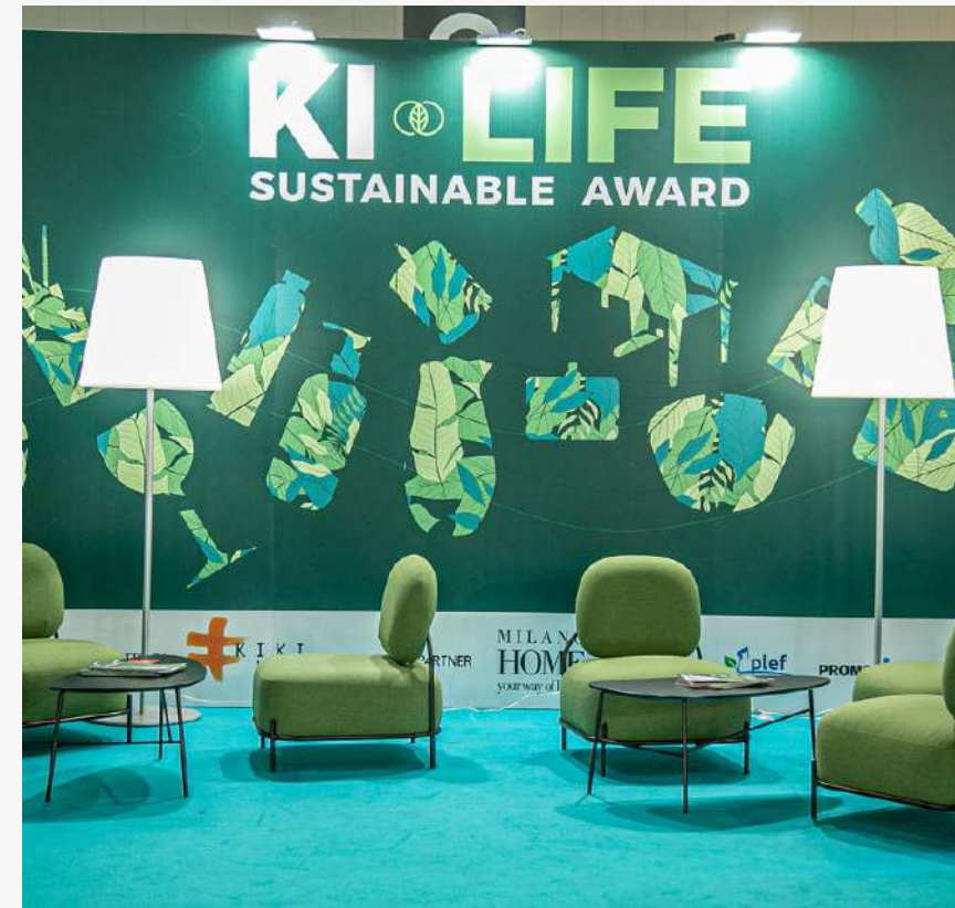
Ki-Life Sustainable Awards