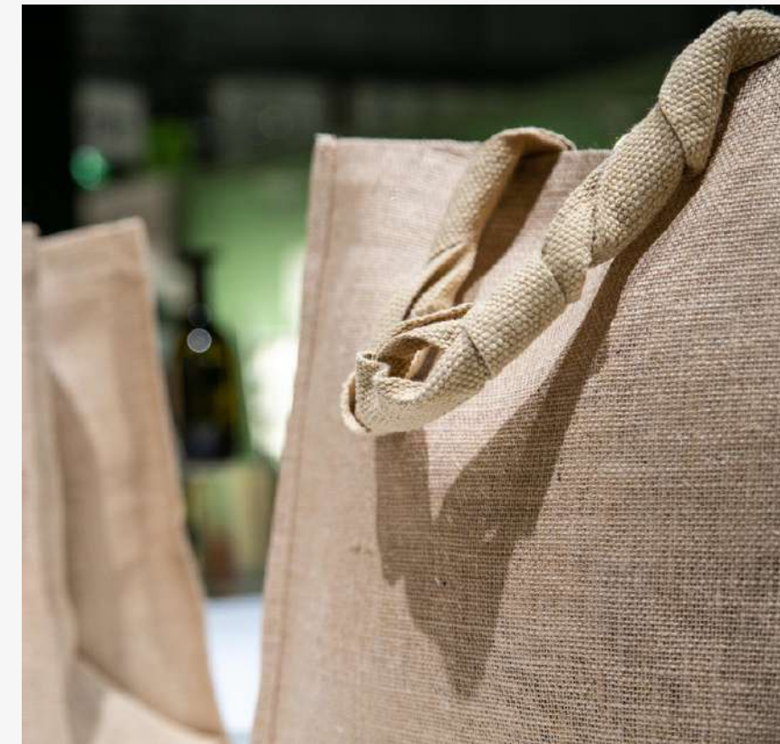
Borse in Amido di Mais