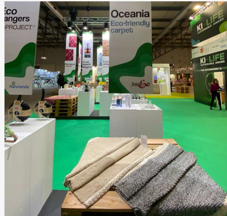
Ki-Life Sustainable Awards