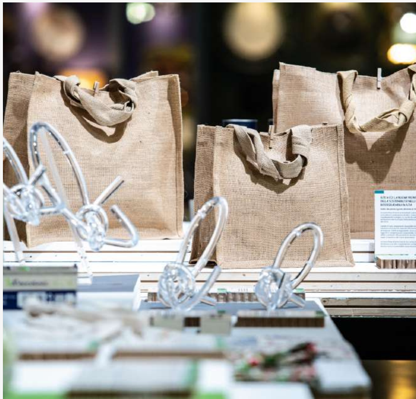
Borse in Amido di Mais